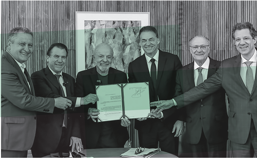
Le président Luiz Inácio Lula da Silva a signé le décret 12.712 le mardi 11 novembre [2025], modernisant le Programme alimentaire des travailleurs (PAT) dans le but d'assurer une plus grande transparence, concurrence et intégrité dans le système de bons alimentaires et de bons repas.

Brasil) sous le gouvernement Bolsonaro, le programme a vu ses conditions d'accès durcies avant d'être rétabli en 2023 avec des ressources amoindries.